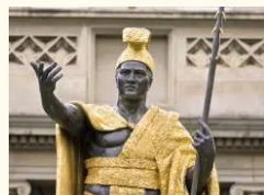
観光名所/イメージ