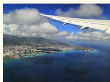
空から見るホノルル/イメージ