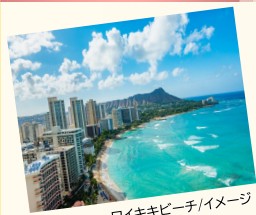
ワイキキビーチ/イメージ

ご自身にて搭乗手続き、出国手続き 19:30~22:10 各空港からJAL便にて空路ホノルルへ