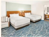
客室の一例/イメージ

ハイアット プレイス ワイキキビーチはハイアットのカジュアルブランドホテル第1号店としてオープン。2023年に全てのお部屋の内装をリニューアルしました。広々とした客室を全426室もち、Wi-Fi、プール、ホテル内イベントスペース、コインランドリーなど充実したサービスやアメニティをご用意しています。ワイキキの東側に位置しており、ワイキキビーチまで徒歩3分。 ※シャワーのみのお部屋になる場合もございます。