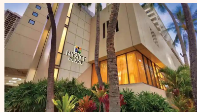
ホテル外観/イメージ